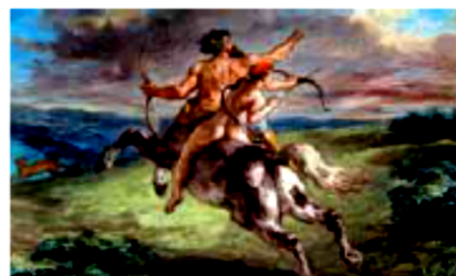
▲ Eugène Delacroix: La educación de Aquiles , 1880.

En la mitología griega, el centauro es un ser con cabeza, brazos y tronco humano y cuerpo de caballo. En general, los mitos lo describen como un ser salvaje que vive sin leyes ni reglas, aunque existen algunas excepciones, como el centauro Quirón, el que destacó por su sabiduría y por educar a varios héroes griegos, tales como Aquiles, Hércules y Ayax.