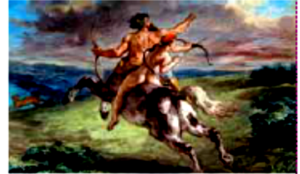
▲ Eugène Delacroix: La educación de Aquiles , 1880.

En la mitología griega, el centauro es un ser con cabeza, brazos y tronco humano y cuerpo de caballo. En general, los mitos lo describen como un ser salvaje que vive sin leyes ni reglas, aunque existen algunas excepciones, como el centauro Quirón, el que destacó por su sabiduría y por educar a varios héroes griegos, tales como Aquiles, Hércules y Ayax.