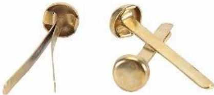
Ganchos de mariposa.

2do Papás en éste paso necesitamos lana o ganchos de mariposa, para atar los orificios de la marioneta Selk'nam, recuerden que no deben complicarse por encontrar los materiales exáctos, si no tienes en su hogar los ganchos, lo pueden hacer con lana, y atan los orificios, siempre les agradecemos su buena voluntad y preocupación con los alumnos(as).