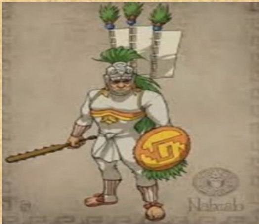
Consejero del gobernante: Viceemperador ,consejero del gobernante, lo reemplaza en su ausencia.