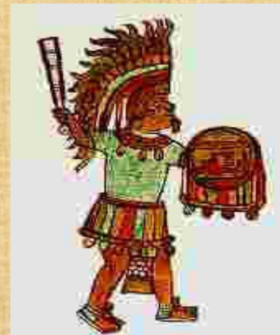
Gobernante de provincia en que se divide el imperio