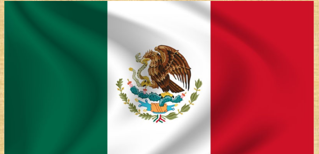
Bandera de México