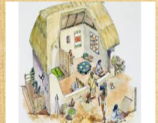
Calpullis: Un grupo de familias que descendía de un antepasado común y habitaban un espacio común.