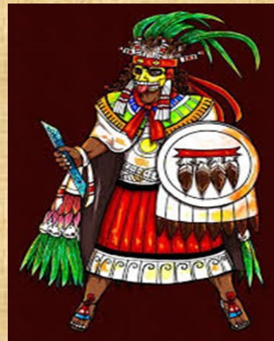
General del ejército: A cargo de asuntos militares.