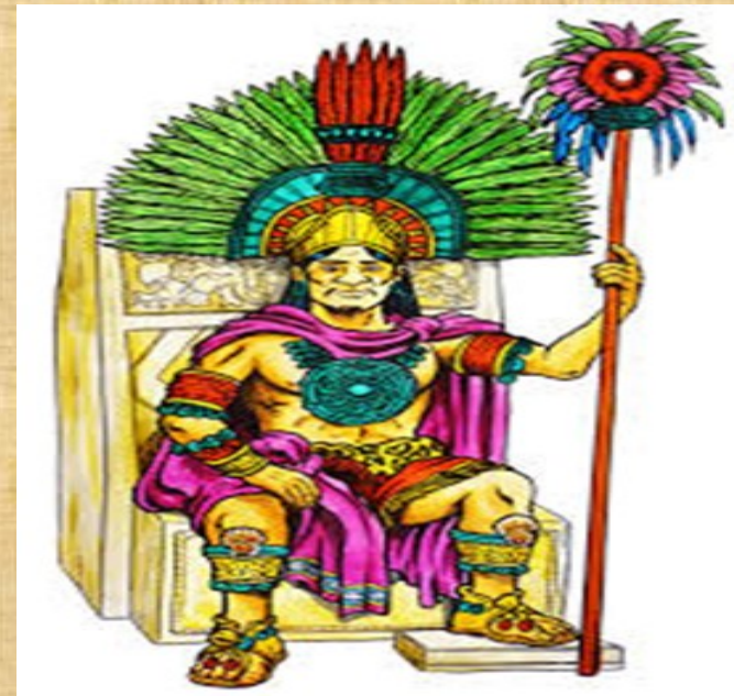
Tlatoani Emperador azteca

En la cima de la organización política azteca estaba el Tlatoani, gobernante supremo que gozaba de poderes absolutos, dictaba justicia, promulgaba las leyes, lidera el consejo supremo donde se tomaban las decisiones importantes y era considerado un representante de los dioses en la Tierra. Uno de sus familiares heredaba su cargo y poder, siendo elegido por el consejo supremo.